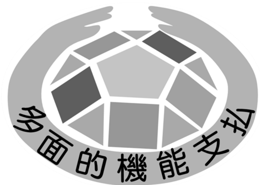
<多面的機能支払交付金 キャッチフレーズ画像 カラー>